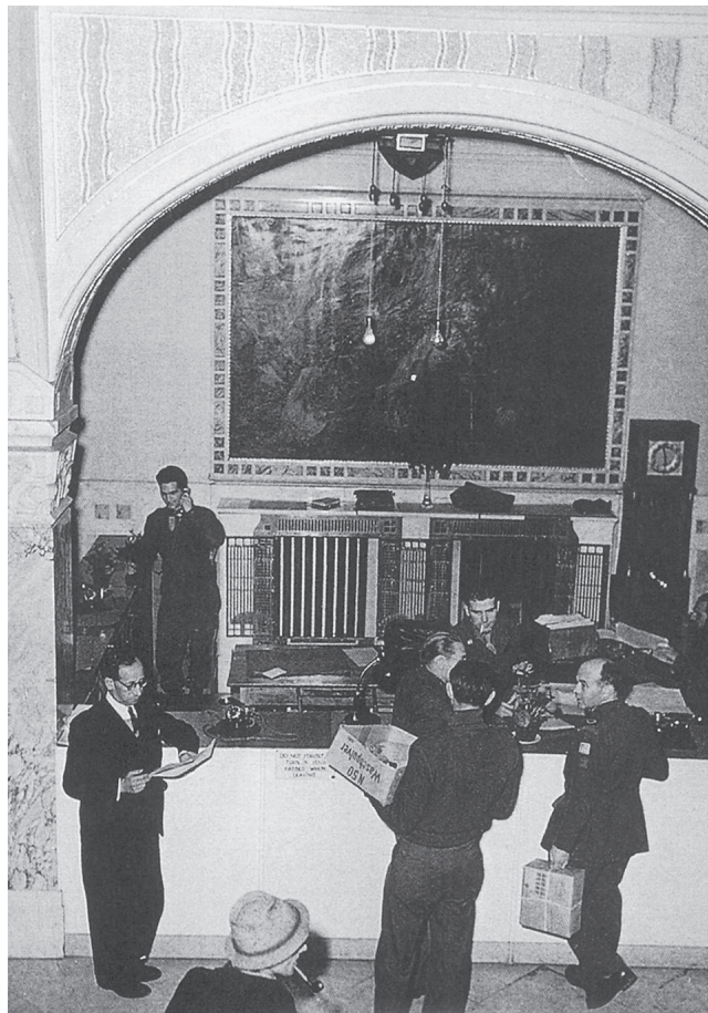
Die Empfangshalle im Schloss zur Zeit des Press Camp

Die Innenräume des Schlosses waren imposant, aber auch durch die militärische Nutzung im Krieg – der Turm hatte als Flakabwehrstellung gedient – durch Flecken und Scharten verunstaltet. Der amerikanische Chefankläger Robert H. Jackson hatte es abgelehnt, die Nürnberger Anklagestäbe im Schloss unterzubringen. Für die internationale Pressegemeinde schien es als Quartier zu genügen. Einige Korrespondenten, darunter William Shirer, sahen dies jedoch anders. Sie waren komfortablere Presselager gewohnt wie das Hotel Scribe in Paris, ein Luxushotel im Herzen der Stadt, das nach der Befreiung von den Deutschen 1944 als Press Camp genutzt wurde. 16 In Stein, wo die Berichterstatter isoliert waren, beklagten sich viele über die überfüllten, unzureichenden und chaotischen Wohnverhältnisse. Teilweise mussten sie zu zehnt auf Armeefeldbetten in einem Raum schlafen. Um die selten funktionierenden Telefonverbindungen gab es Gerangel. Die sanitären Anlagen reichten bei weitem nicht aus, vor den wenigen Waschräumen bildeten sich jeden Morgen Schlangen. Im Pyjama liefen die Pressever-